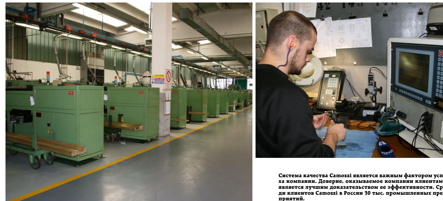
Система качества Samozzi является важным фактором успеха компании. Доверие, оказываемое компании клиентами, является лучшим доказательством ее эффективности. Среди клиентов Samozzi в России 30 тыс. промышленных предприятий.

Долгосрочное планирование работы в стране – составная часть мировой стратегии Samozzi. Она направлена на активное освоение «рынков XXI века»: России, Китая, Индии, Бразилии.