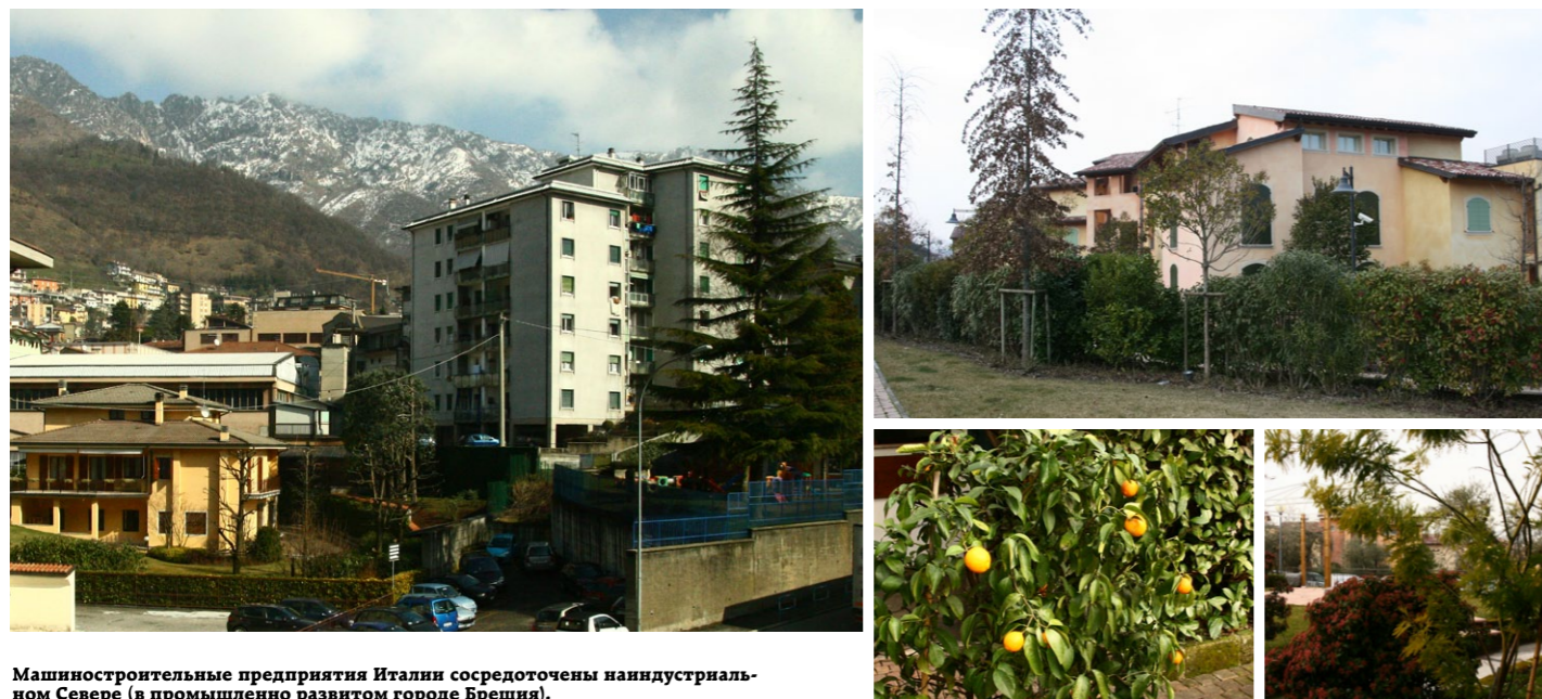
Машиностроительные предприятия Италии сосредоточены на индустриальном Севере (в промышленно развитом городе Брешиа).