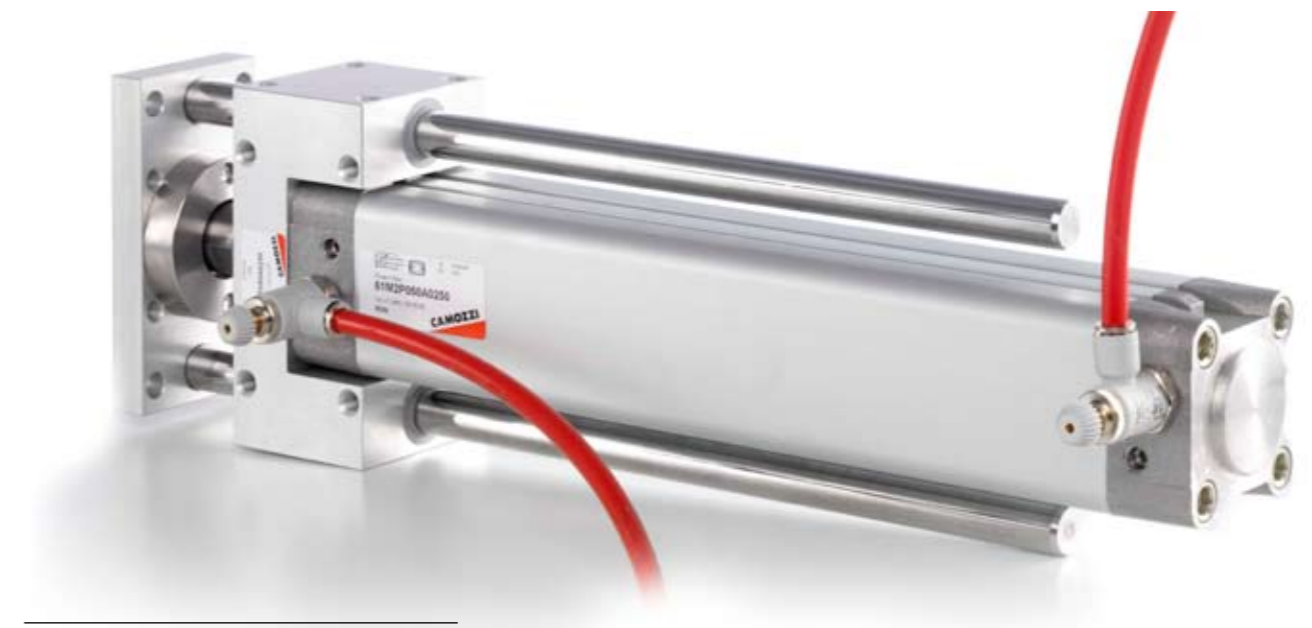
Рис. 1. Привод линейного перемещения

Качество нашей продукции подтверждается долгосрочными партнерскими отношениями с крупными российскими компаниями, такими как: Вязниковский, Архангельский деревообрабатывающие комбинаты; ЗАО «Деревообработка» (Ленинградская обл.), «Евродом» (Московская обл.) и др. ООО «Бакаут» плодотворно сотрудничает с крупной домостроительной компанией ЗАО «Комбинат малоэтажного домостроения» (г. Бор, Нижегородская обл.). Наше сотрудничество заключается как в поставке нового, так и в модернизации уже имеющегося оборудования.